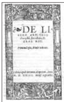
Erazmus R.: O svobodné vůli

Erazmus Roterdamský ve svém díle „O svobodné vůli“ odpovídá na otázku spolupráce lidské vůle ve věci spasení kladně. „I když totiž svobodná vůle utrpěla hříchem újmu, přesto zcela nevyhasla; a jím byla ochromena, takže než se nám dostane milosti, tíhneme spíš ke zlu než k dobru, přesto zcela nezanikla...“ Erazmus kromě biblických argumentů používá také argumenty pragmatické: Když lidé uslyší o tom, že nemají svobodnou vůli, kdo bude chtít žít zbožně a kdo bude chtít věřit? Hlásání popření svobody lidské vůle by mělo podle Erazma velmi neblahé následky pro lidskou morálku. Někteří by z toho mohli vyvozovat marnost veškerého snažení v oblasti dobrých skutků a etického snažení, což je pro humanisticky zaměřeného Erazma nepřipustné.