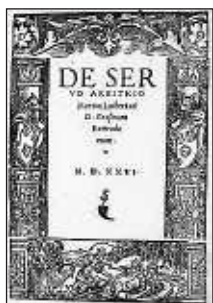
M. Luther: O ztročené vůli

Lutherova reakce na Erazmovy názory je prudce odmítavá. Ve své knize „O ztročené vůli“ Luther rozhodně upírá lidské vůli jakoukoli svobodu, pokud jde o spasení člověka. Podle něj naopak vše působí Bůh, který jediný má svobodnou vůli a může konat, co se mu líbí. Tento postoj se může jevit na první pohled jako tvrdošíjná reakce na přehnané zdůrazňování skutků a zásluh a na kupčení s odpustky v tehdejší katolické církvi. Když se však pozorně začteme do Lutherovy argumentace pomocí biblických pasáží, zvláště pak z Pavlových listů a Janova evangelia, vidíme, že jeho popření vychází především z pečlivého výkladu Písma oprostěného od nánosu různých tradičních pohledů.